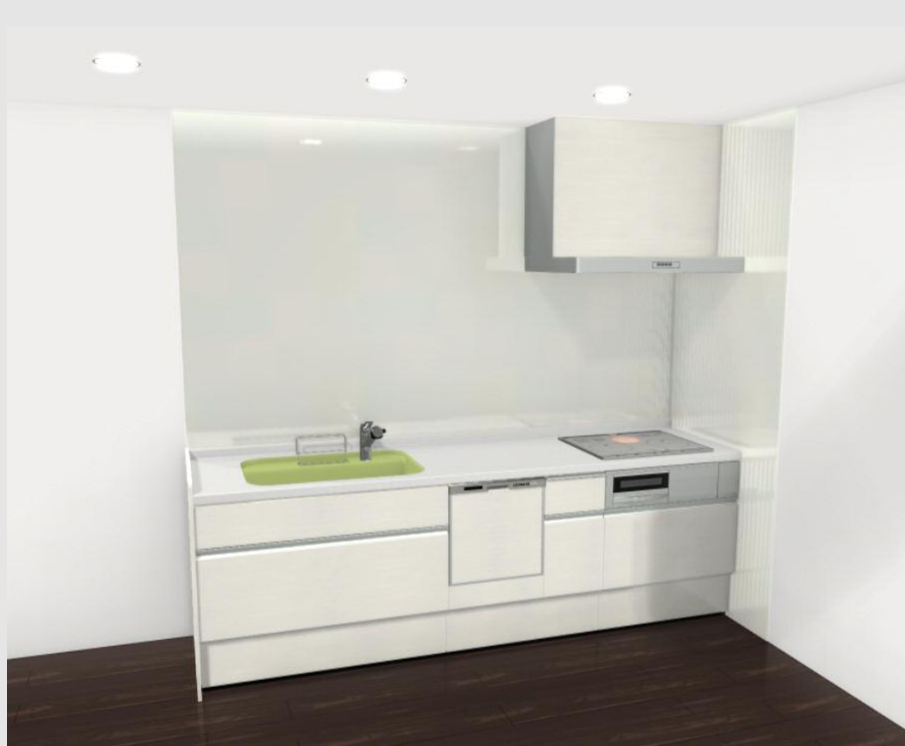
CG合成によるイメージ画像です。 現場調達品、シリーズ外選定品に関しては表現しておりません。